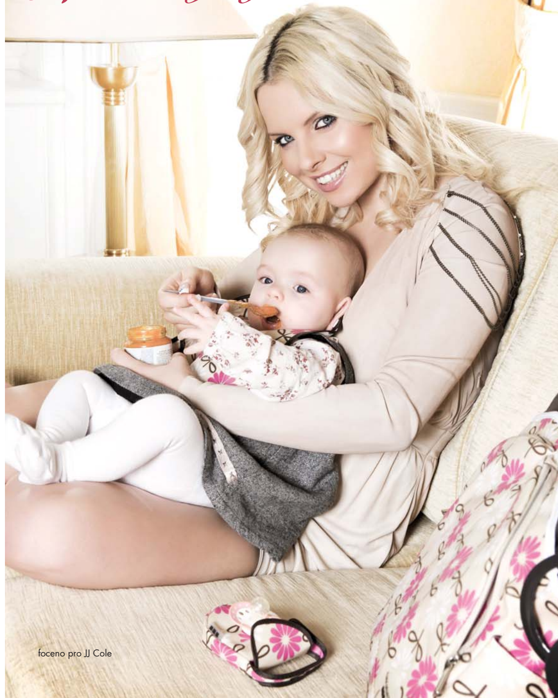
faceno pro JJ Cole